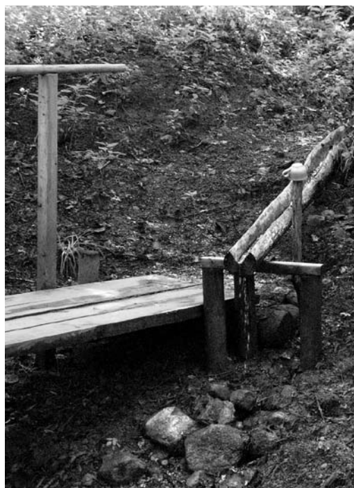
AĻOGS, arī AVOTS